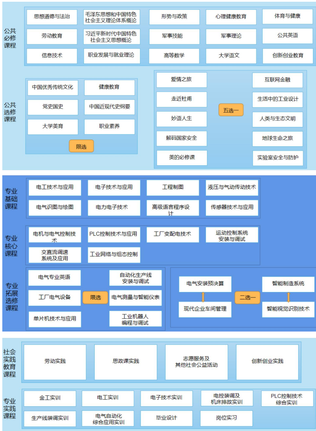
图 1 电气自动化技术专业课程体系图